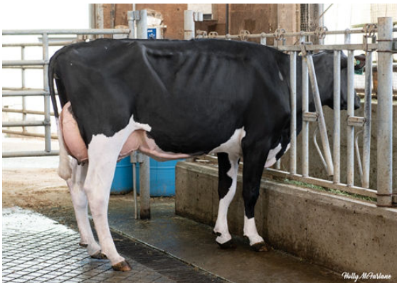
PROGENESIS FASTBALL PRISSY DAM